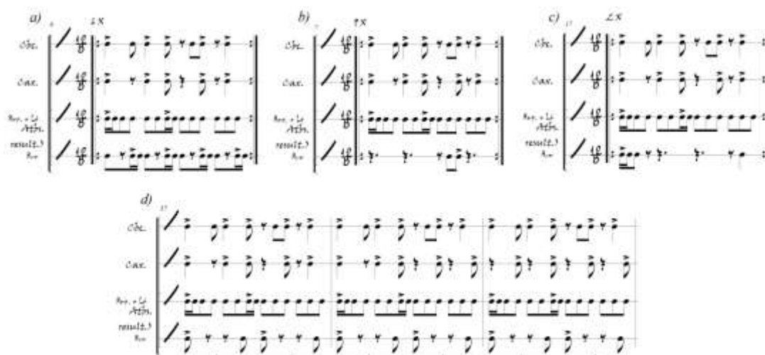
Figura 1: processo nº 1 (ressignificação rítmica)

Um breve passeio analítico pelo “Adarrum de Ogum” nos coloca diante do atabaque Rum como um agente rítmico cuja função principal é propor diferentes feições e sensações relacionadas ao padrão rítmico apresentado pelos atabaques Rumpi e Lé (reforçado pela cabaça e o caxixi), que é ciclicamente reiterado durante todo o excerto musical. Nessa direção, o Rum consegue promover diferentes impulsos de ordem rítmica, capazes de alterar (metricamente e em termos de disposição das acentuações principalmente) a maneira como o padrão rítmico principal da música é percebido, fazendo com que ele seja constantemente re-significado, como pode ser visto na figura 1, que demonstra quatro intenções rítmicas associadas a um mesmo material musical.