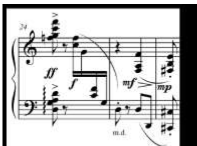
Exemplo 7: "Cotidiano", c. 24, pentacorde pentatônico 5-35.