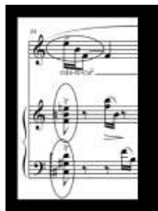
Exemplo 10: "Cotidiano", c. 34, tricorde 3-5