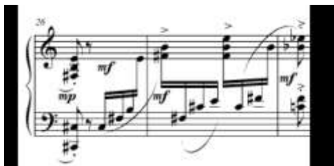
Exemplo 5: "Cotidiano", cc. 26-28, tetracorde 4-23