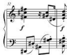
Exemplo 8: "Cotidiano", cc. 32-33, pentacorde pentatônico 5-35

Um dos acordes favoritos de Miranda, o trítono-quarta (ou semitom-trítono), classe de conjuntos 3-5 (016), está na harmonia e na melodia como um elemento de unificação (Ex. 9-12).