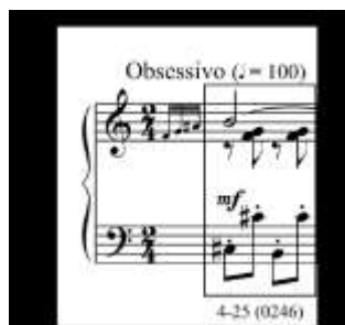
Exemplo 1: “Cotidiano”, c. 1

O uso de outros de conjuntos também simétricos pode ser constatado nos exemplos a seguir (Ex. 2 e 3).