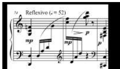
Exemplo 6: "Cotidiano", cc. 74-76, tetracorde 4-23