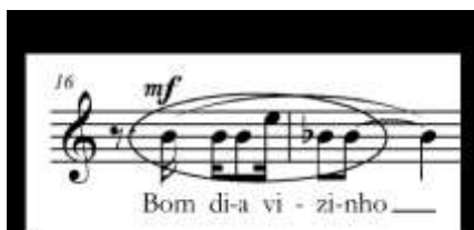
Exemplo 11: "Cotidiano", tricorde 3-5