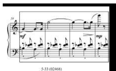
Exemplo 3: “Cotidiano”, cc. 19-22

Simetria é uma das características da composição de Miranda. Ela pode ser vista no comprimento das frases, no tamanho das seções e no uso de formas mais tradicionais, embora geralmente modificadas. Em "Cotidiano", os compassos 5 e 6 são exemplos de simetria entre os planos horizontal e vertical. Ambos os vértices usam o tetracorde 4-18 (uma tríade diatônica mais um semitom adicional) como base para o gesto musical (Ex. 4).