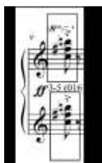
Exemplo 9: "Cotidiano", c. 9, tricorde 3-5

Um dos acordes favoritos de Miranda, o trítono-quarta (ou semitom-trítono), classe de conjuntos 3-5 (016), está na harmonia e na melodia como um elemento de unificação (Ex. 9-12).