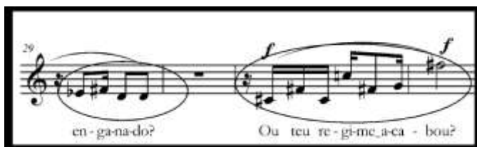
Exemplo 12: "Cotidiano", cc. 29-32, tricorde 3-5

Sugestões para imagética visual e interpretação